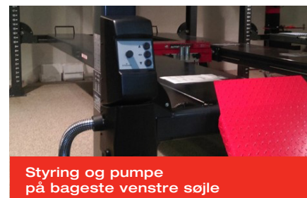
Styring og pumpe på bageste venstre søjle